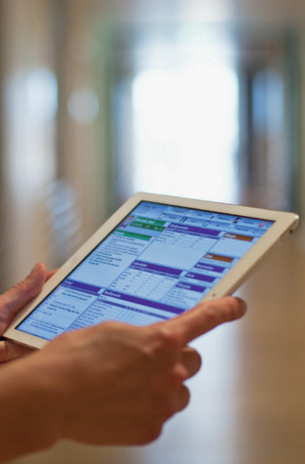
Ständiger Begleiter und integraler Behandlungspartner: Tablet und KIS-Ärztecockpit

Es folgten Produktentwicklung, Spezifikation, Installation technischer Voraussetzungen, Programmierung, Customizing, Test- und Pilotphase, Optimierung, Stabilisierung, Abschlussevaluation der Anwender und deren Schulung sowie Produktivstart des Ärztecockpits im gesamten Spital symbolisch als »Weihnachtsgeschenk«.