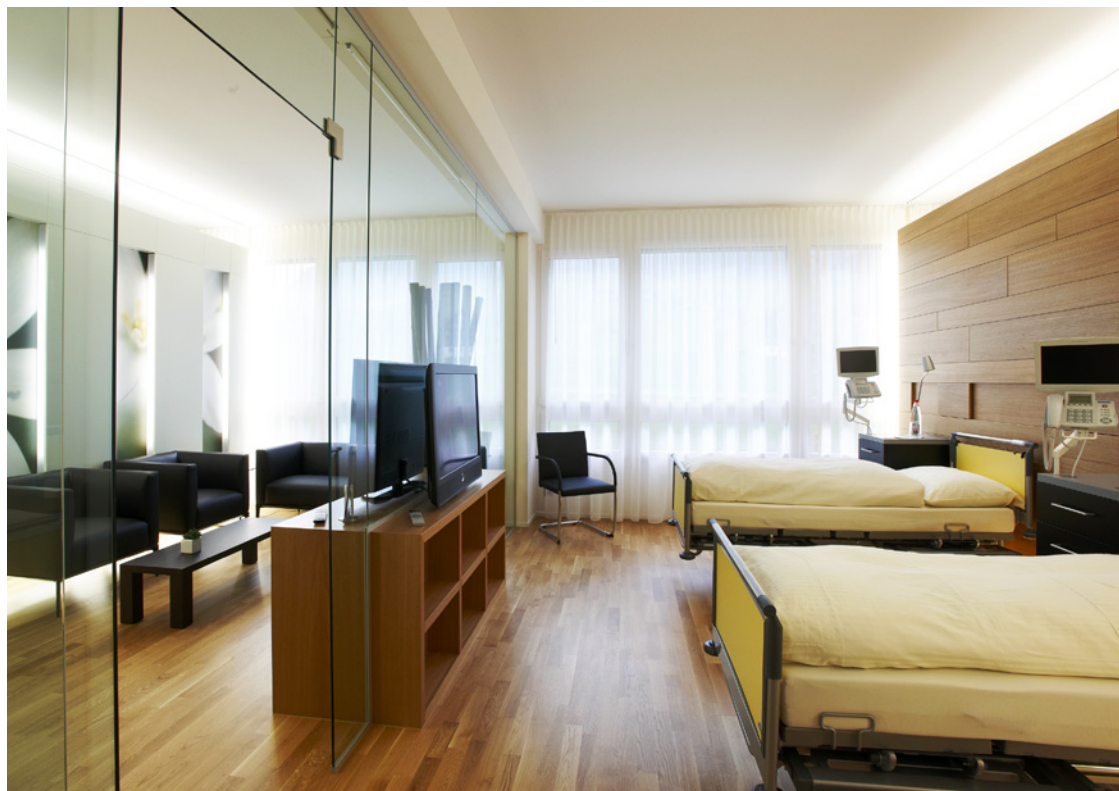
Exzellente Zimmer: wohnlich und funktional zugleich mit hotelhaftem Wohlfühlfaktor

Im vergangenen Jahr 2014 wurden zahlreiche Projekte erfolgreich realisiert: die Online-Verord nung in der Radiologie, diverse Schulungen und