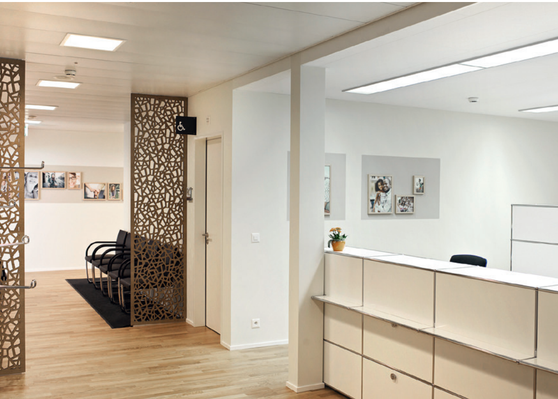
Ansprechendes Ambiente in allen öffentlichen Räumlichkeiten für die Patientinnen und Patienten sowie Mitarbeitenden (Empfang Physiotherapie)