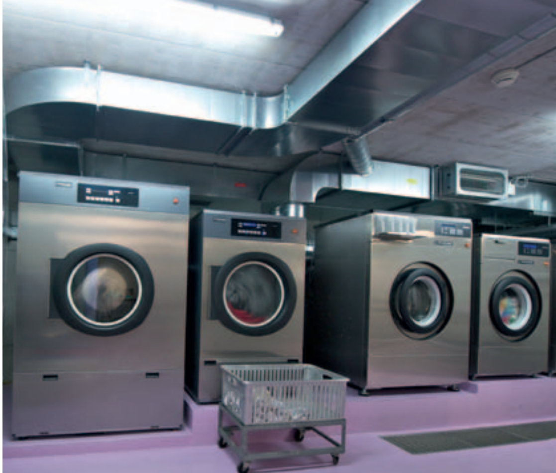
Die Inhouse-Wäschereilösung vom QDZ Künzle-Heim & Huus Emmersberg

Weitere Informationen www.qdz.ch und www.schulthess.ch