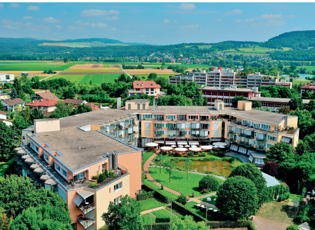
Idealer Ort für Kooperationen im Gesundheitswesen: das Park-Hotel Bad Zurzach

Wohnen und Leben wie im 4-Sterne-Hotel bietet das RPB auf der speziellen Abteilung im Park-