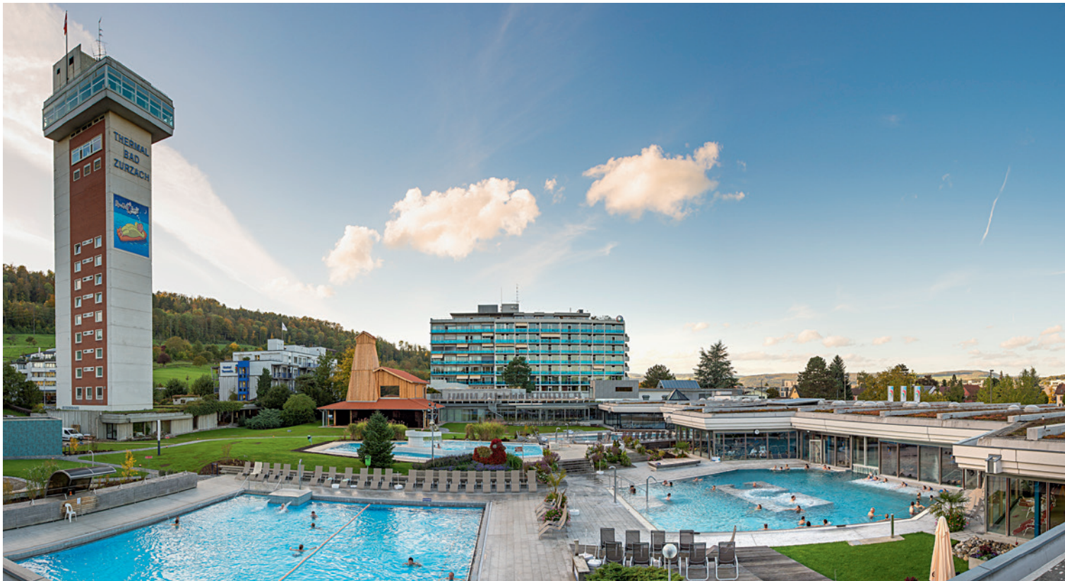
Ein Quell der Lebensfreude: das neu ausgebaute Thermalbad Zurzach

mentale Stabilisation der Wirbelsäule. Dadurch kommt es zu einer erhöhten Abnutzung und bei spontanen Bewegungen zu Schmerzen und Verletzungen», erläutert der erfahrene Therapeut. Im neu eröffneten Rückentherapie-Center kann nun die stabilisierende tiefliegende Muskulatur in der Mittelstellung des Beckens und der Lendenwirbelsäule optimal vom Nervensystem angesprochen und trainiert werden (wir berichten in «clinicum» 1/2015 ausführlicher darüber).