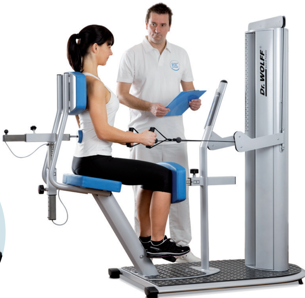
Innovativer Partner des Park-Hotels: die Physiotherapie Emery mit modernster Rückentherapie

«Seit der Einführung des Case Managements ist dieser Austausch noch wichtiger geworden, denn wir wollen den Patienten von Anfang bis zum Schluss ihrer Behandlung eine möglichst