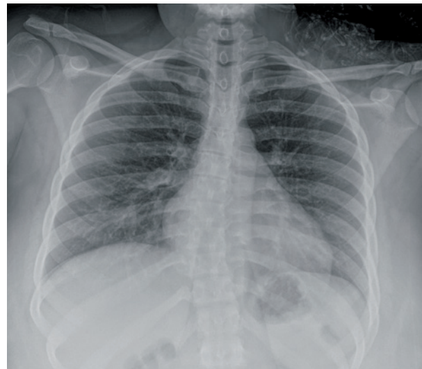
Thorax PA avec MUSICA 3 qui offre de nouvelles perspectives aux radiologues.