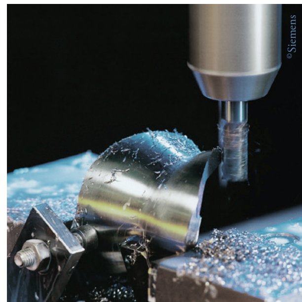
Die neue Technologie verspricht, Planungsphasen bei Operationen zum Gelenkersatz enorm zu verkürzen. Zugleich ermöglicht sie eine präzisere Fertigung der Prothesen.