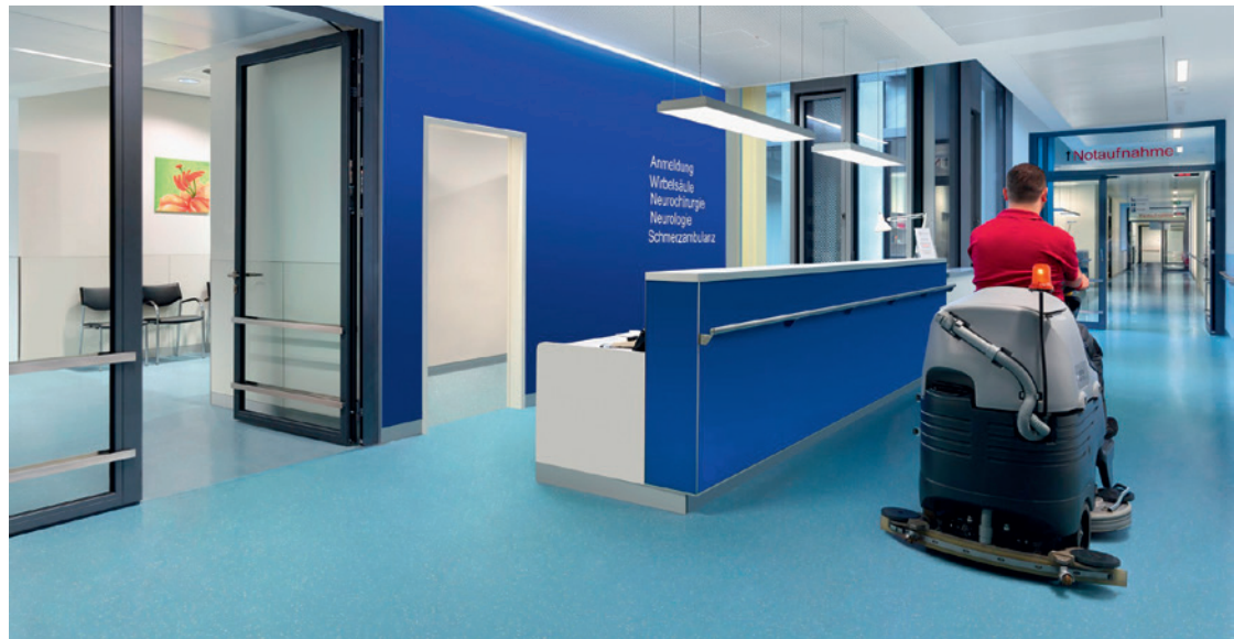
Kautschuk-Bodenbeläge von nora flooring systems sind nicht nur besonders robust, sondern lassen sich auch sehr leicht reinigen.

In hochfrequentierten Gebäuden wie Krankenhäusern ist das extrem schwierig. Bei beschichteten Belägen ist zudem in kurzen Abständen eine Grundreinigung erforderlich, bei der die Polymerschicht zunächst chemisch abgetragen und dann neu aufgebracht werden muss. Nora-Kautschukböden benötigen dagegen nur eine einfache Unterhaltsreinigung, müssen also nur einstufig gewischt werden und können völlig unproblematisch mit modernen Reinigungsmaschinen bearbeitet werden. Dies ist auch im laufenden Betrieb ohne Einschränkungen für Patienten und Personal problemlos möglich.