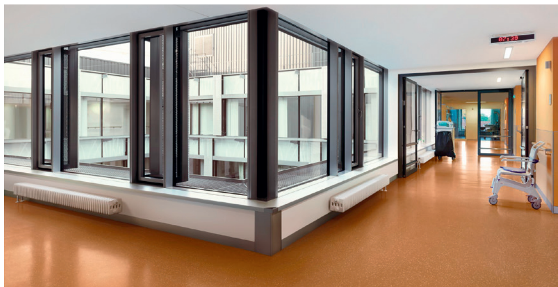
Elastisch, widerstandsfähig, langlebig und ästhetisch: Selbst nach jahrzehntelangem Einsatz sehen nora-Bodenbeläge aus wie neu.