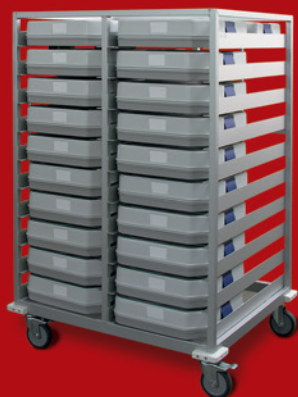
Transportwagen zu Caldo Casa