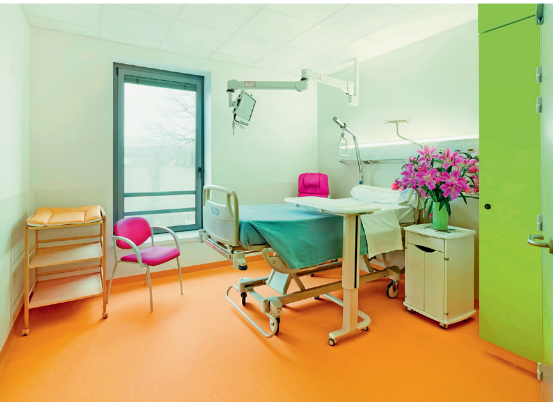
Elastisch, widerstandsfähig, langlebig und trendig: Selbst nach jahrzehntelangem Einsatz sehen nora-Bodenbeläge aus wie neu.

Durch ihre dichte, geschlossene Oberfläche sind nora-Bodenbeläge äusserst verschleissfest, lassen sich leicht reinigen und sehen trotz hoher Beanspruchung auch nach vielen Jahren nahezu aus wie neu. Überdies benötigen sie im Gegensatz zu anderen elastischen Fußbodenbelägen keine Beschichtung. Damit bieten die nora-Produkte einen entscheidenden Vorteil: Denn die Beschichtungen anderer elastischer Bodenbeläge nutzen sich ab und müssen in