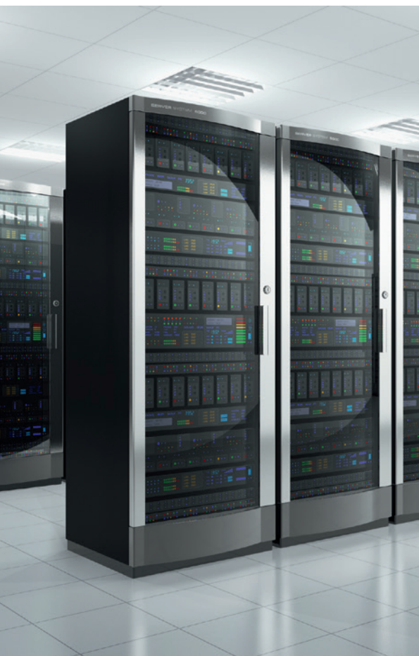
Das rasante Datenwachstum fordert auch mehr Speicherplatz

Nachdem im Januar 2013 der Produkt-Entscheid gefallen war, begann im April die Umsetzung. Bereits am 30. Juli 2013 waren alle Schnittstellen auf BIS6 produktiv. Ab August 2013 läuft der Voll-Betrieb mit HINT integrate .