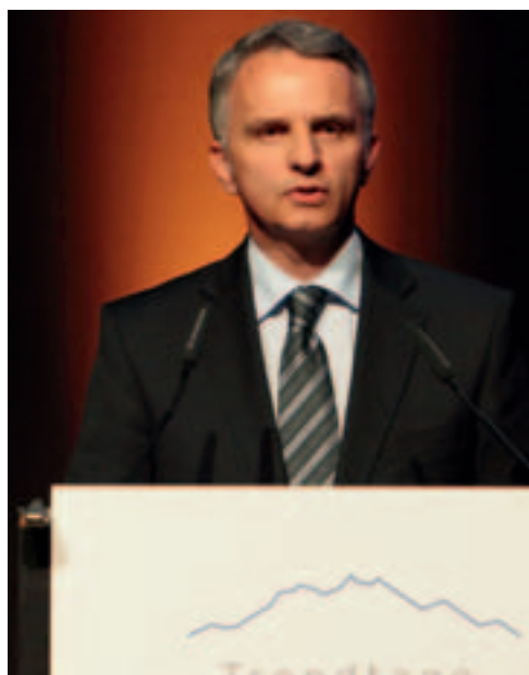
A peine élu et déjà de la partie : Le conseiller fédéral Didier Burkhalter a accueilli de nombreux visiteurs et visiteuses à l'occasion des Trendtage Gesundheit Luzern de cette année.

Le succès fut au rendez-vous dès la première édition. Immédiatement, « clinicum » est devenu le partenaire médiatique. De cette façon, nous avons pu informer dès le premier jour. Ce succès immédiat vous a-t-il surpris ?