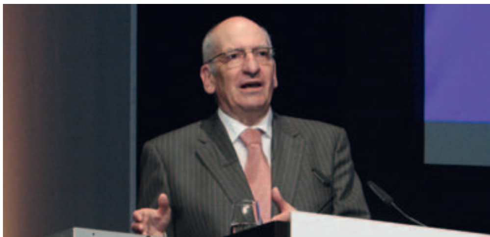
L'ancien conseiller fédéral Pascal Couchepin a toujours été ravi des Trendtage Gesundheit Luzern ; il a qualifié l'événement comme étant le FEM de la santé.

à stopper la tendance ? Sur quelles thèses pouvons-nous nous appuyer pour déterminer les possibilités d'actions concrètes ?