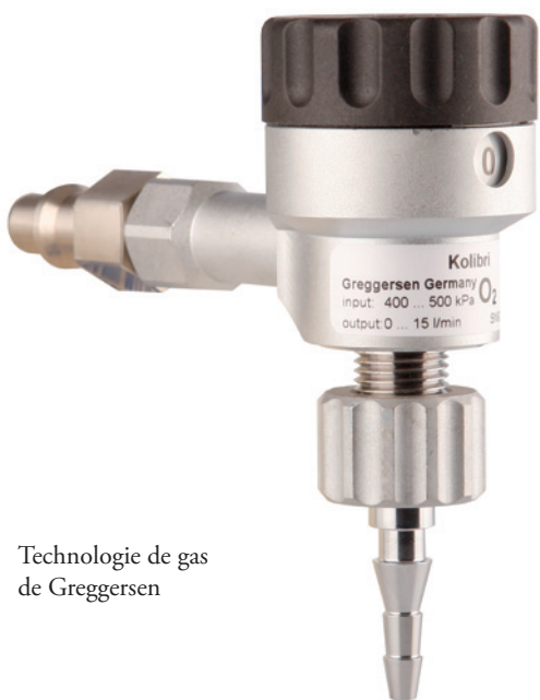
Technologie de gas de Greggersen