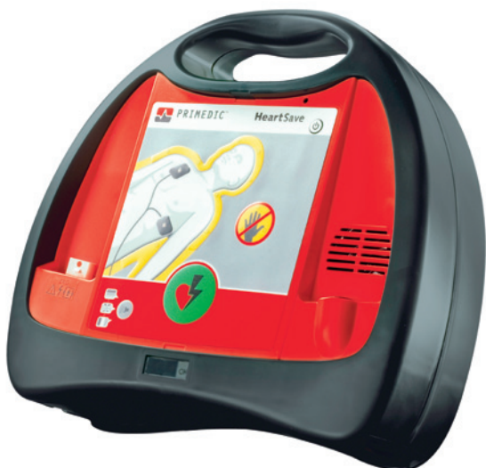
Défibrillateur et appareil de formation «Trainer» de Primedic