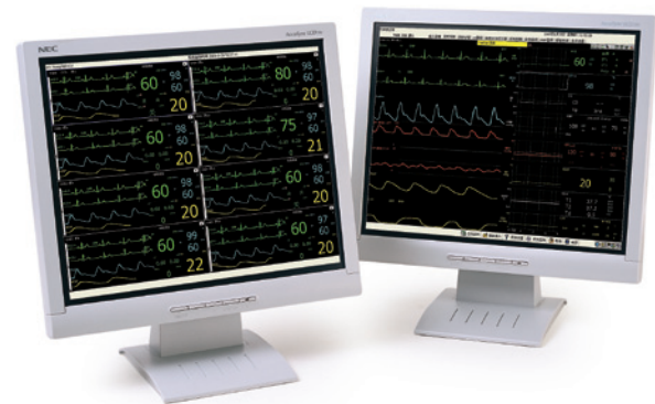
Moniteurs patients et centrale de surveillance de Mindray

Comme force de l'entreprise notre partenaire interviewé nomme l'expertise et la connaissance approfondie du marché, la capacité d'offrir une large gamme de produits à partir d'une seule source, la sécurité de commercialiser des produits de qualité, le prix attractif et les conditions de service rapide, professionnel et durable, ainsi que la société sœur Hospitec, leader du marché suisse de la maintenance propose la réparation, l'entretien et l'étalonnage dans le secteur Med Tech. Environ 60 techniciens médicaux chevronnés offrent des garanties de professionnalisme et de soutien des hôpitaux et d'autres clients dans la réalisation de la disponibilité ininterrompue de l'équipement pour un bon fonctionnement et la sécurité en général.