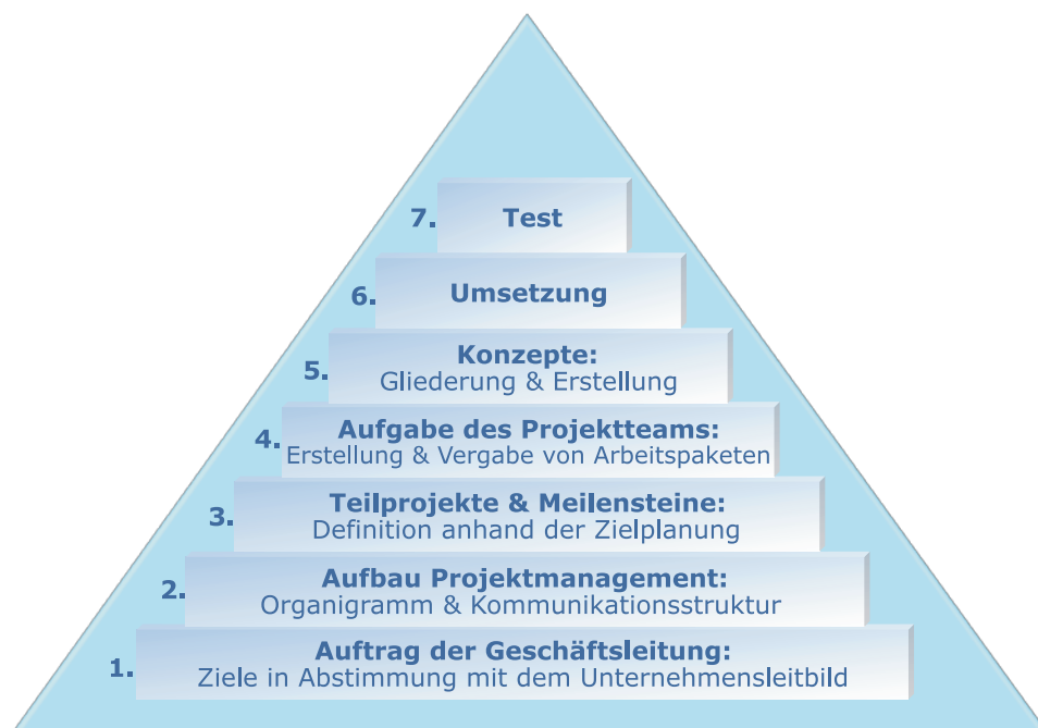
Abbildung 1: Projektdreieck MMC für SwissDRG in 7 Ebenen

Wenn im Fusse des Projektdreieckes MMC für SwissDRG auf Ebene 1) kein klarer Auftrag gegeben wurde, findet das direkt hier seinen ersten negativen Ausdruck (bspw. Unsicherheit bei den Mitarbeitenden, personelle Kontinuität ist gefährdet).