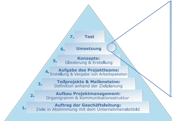
Abbildung 2: Konzepte umsetzen – Themenauswahl