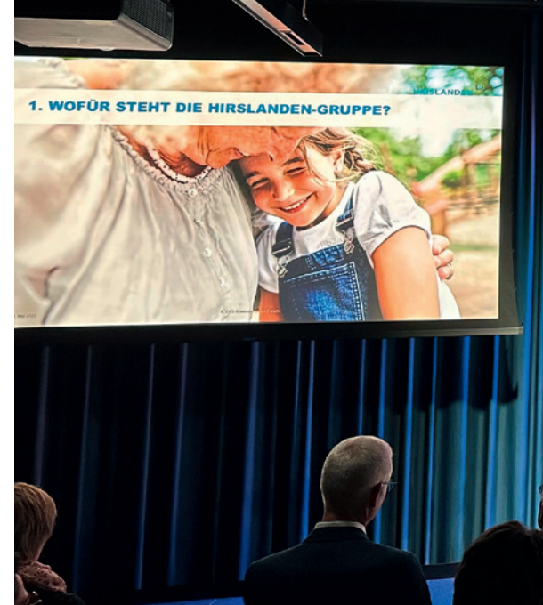
Mehr Innovation, Kreativität und persönliche Atmosphäre bieten: ...