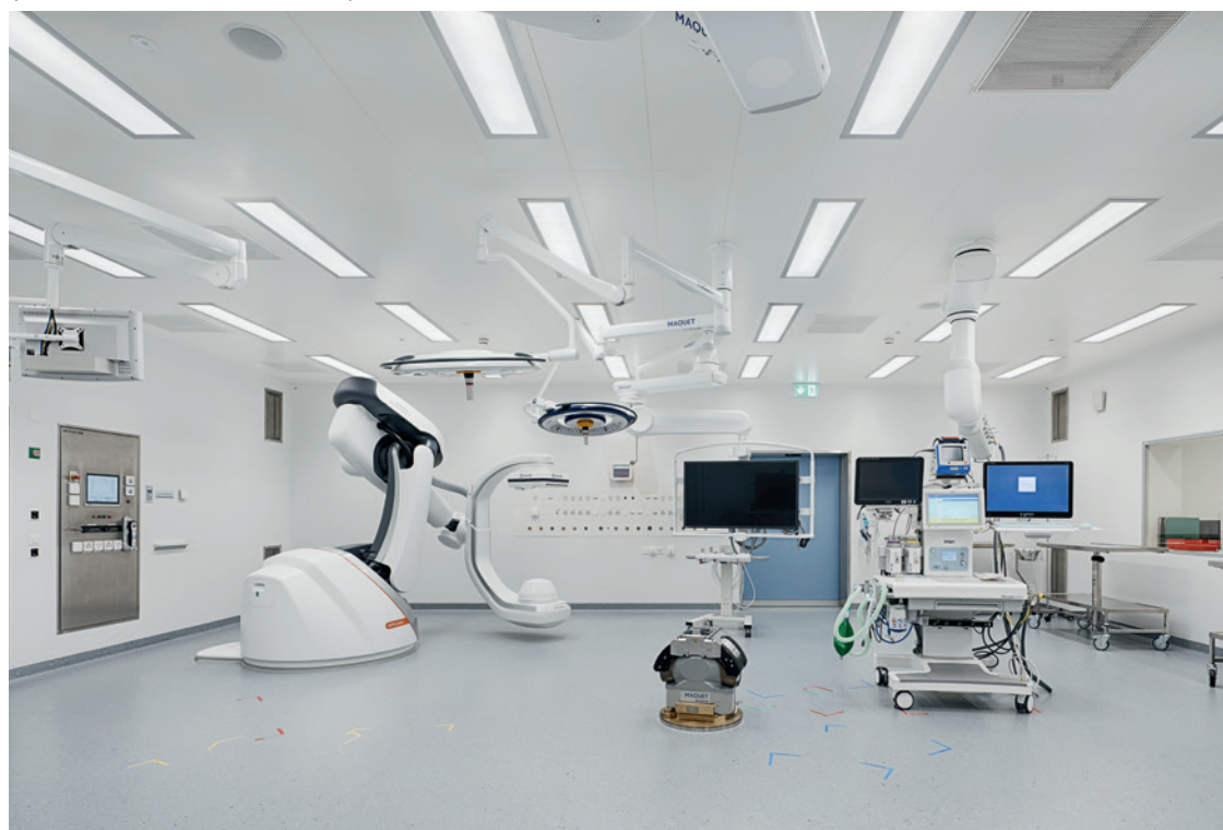
Ein herausforderndes Projekt war der OP-Erweiterungsbau des Luzerner Kantonsspitals: Hohe technische und hygienische Anforderungen gab es bei der Realisierung der Operationsräume (inkl. Technik und Nebenräumen) in Stahl-Modulbauweise.

Da Holz häufig aus Schweizer Wäldern stammt und für den Zuschnitt weniger Energie nötig ist als für die Herstellung von Backsteinen und Betonelementen, wird dem ökologischen Bauen schon sehr Rechnung getragen. Dank der Modulbauweise reduzieren sich Transportwege und Fertigungszeiten auf der Baustelle und beim Recyclen geht das Laufener Unternehmen besonders innovative Wege, die eine höchst interessante Erweiterung zur Verwendung von Holz darstellt. Am Standort Stein/AG entsteht zurzeit ein Büroneubau. Der lehmerdige Aushub wird in unmittelbarer Nähe getrocknet, in Schalungen gefüllt und per Roboter zu grossen Lehmelementen gestampft. Dann steht das recycelte Material als vorgefertigte Elemente von 3.0 x 1.4 Metern erneut zur Verfügung. Im neuen Bürogebäude dienen die Lehmelemente der Konstruktion der Treppenhaus- und Liftwände.