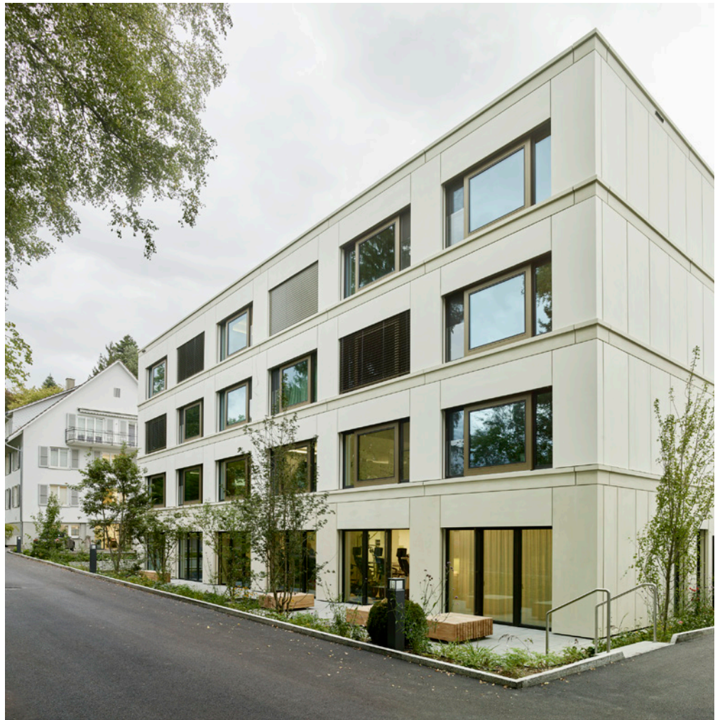
Bei der Privatklinik Linde, Biel, ist eine Fassadenkonstruktion mit vorgefertigten Holzelementen und einer Verkleidung mit Faserbeton und Holz-Metallfenstern in Eiche eingesetzt.

Holz vermittelt in der Privatklinik Linde eine behagliche und beruhigende Atmosphäre für die optimale Genesung der Patienten.