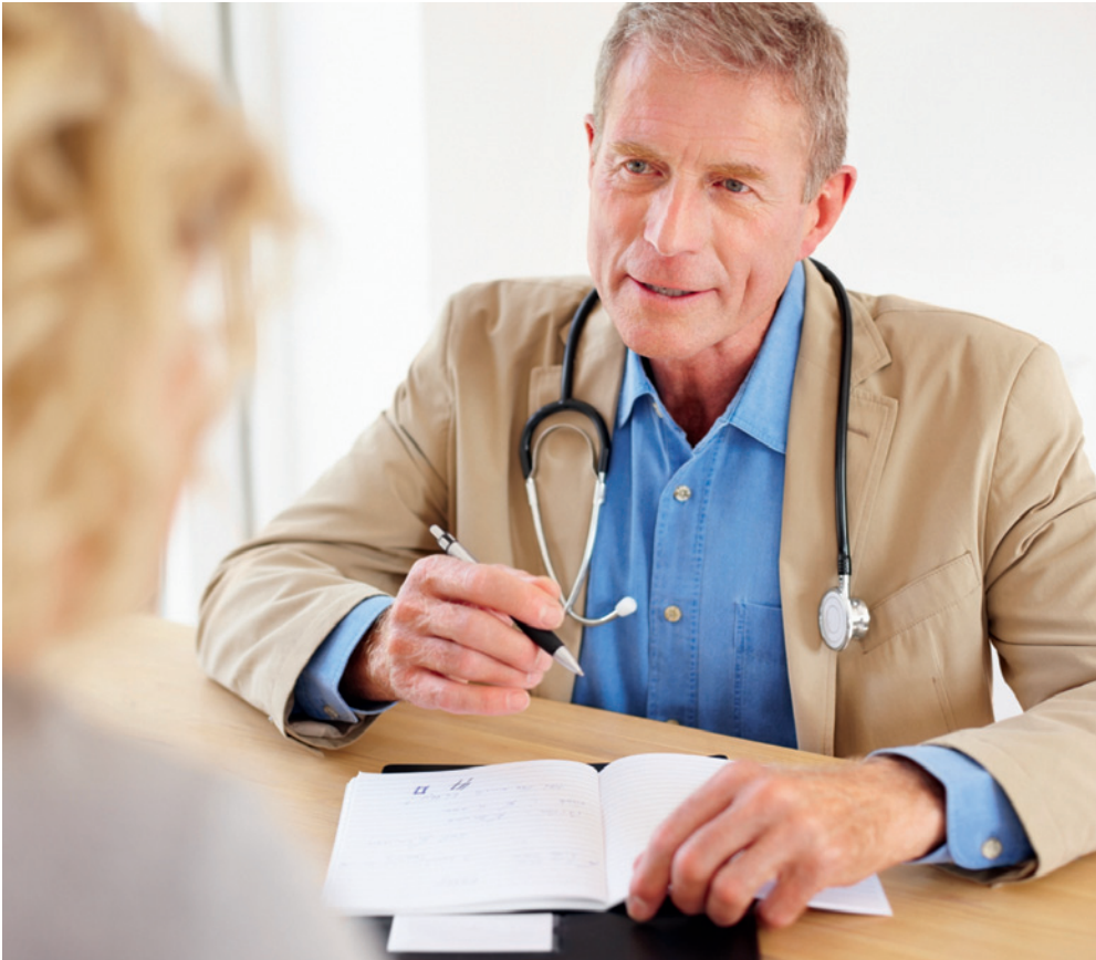
Le succès commence par le médecin de famille: Il soutient ses patients d'utiliser individuellement leur carte d'assurance spéciale.