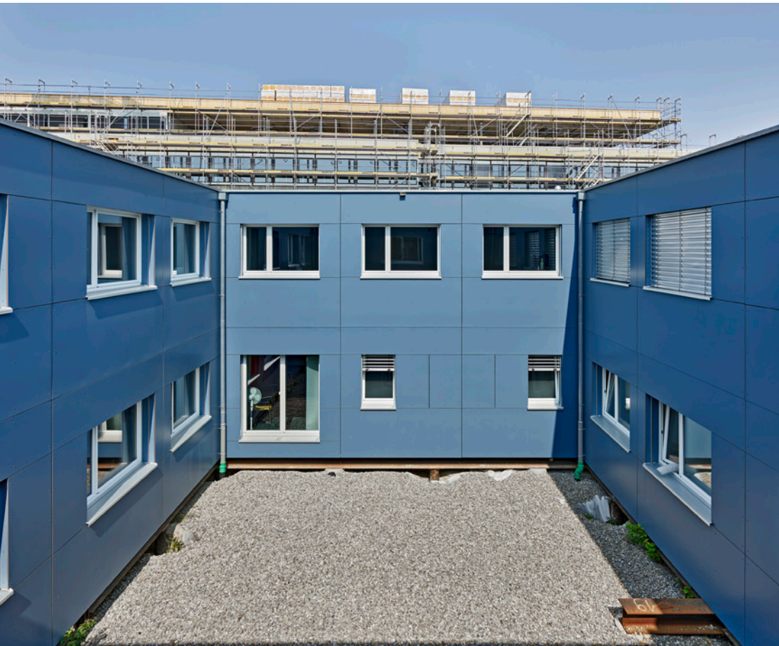
Ein grosszügiger Innenhof sorgt für viel Lichteinfall in alle Räume des Rochade-Gebäudes.

wie Wartebereichen, Technik- und EDV-Räumen. Weiter besteht ein Annexbau, in dem eine Radiologiestation mit MRI untergebracht ist. Interessant ist das Fundament des Modulbaus. Er steht durchgehend auf dem Dach einer geschützten Operationsstätte (GOPS). Die luftige Atmosphäre des Gebäudes wird durch einen grosszügigen Innenhof erreicht, dank dessen in beinahe allen Zimmern natürliches Tageslicht gewährleistet wird, was die Raumqualität stark erhöht. Entsprechend erfreulich fiel schon bald das Echo der Mitarbeitenden aus, die sich im Gebäude wohl fühlen.»