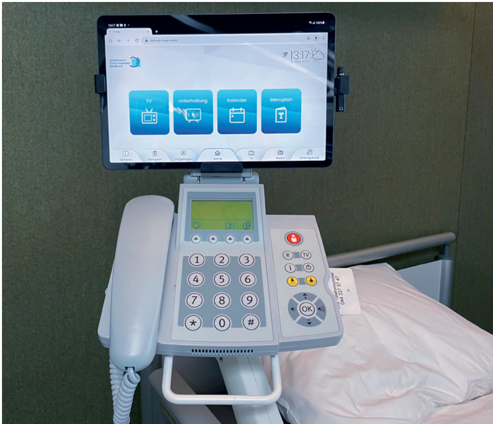
Plus de confort pour le patient juste à côté du lit – et installé rapidement et facilement.