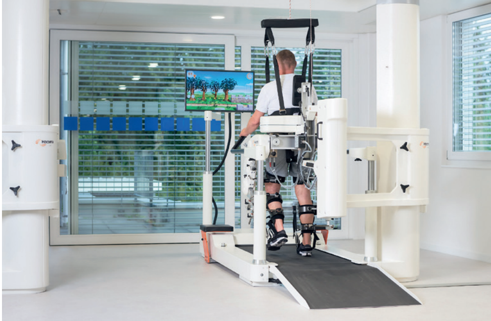
Der LOKOMAT ist einer der am weitesten verbreiteten Roboter-assistierte Therapiegeräte fürs Gangtraining.