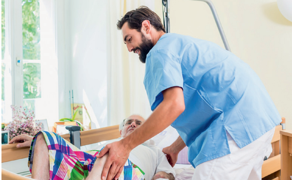
La mobilisation de personnes comporte de grands risques de santé pour le personnel soignant: la mise en œuvre d'une solution de branche contribue aussi la manutention correcte de charges.

Créée en 1999, la solution de branche de Sécurité au travail en Suisse offre aussi aux institutions, depuis le départ, des solutions adaptées. Les modules «Institutions sociales» et «Facility Management» couvrent toutes les activités pertinentes pour tous les domaines de travail des institutions de soins et structures sociales, synthétisées dans des chapitres aux fins de l'évaluation des risques, de l'assistance et des soins à la manutention de charges en passant par la gastronomie et la lingerie. Les membres bénéficient en plus d'une vaste offre de formations de base et continues.