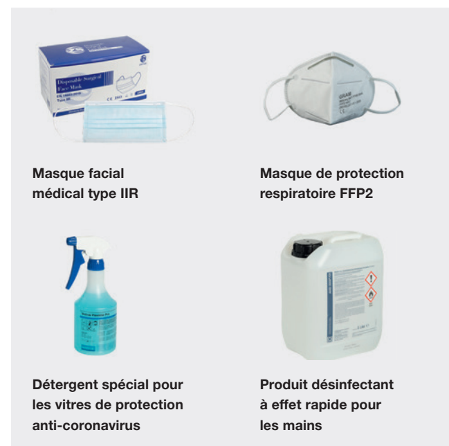
Masque facial médical type IIR