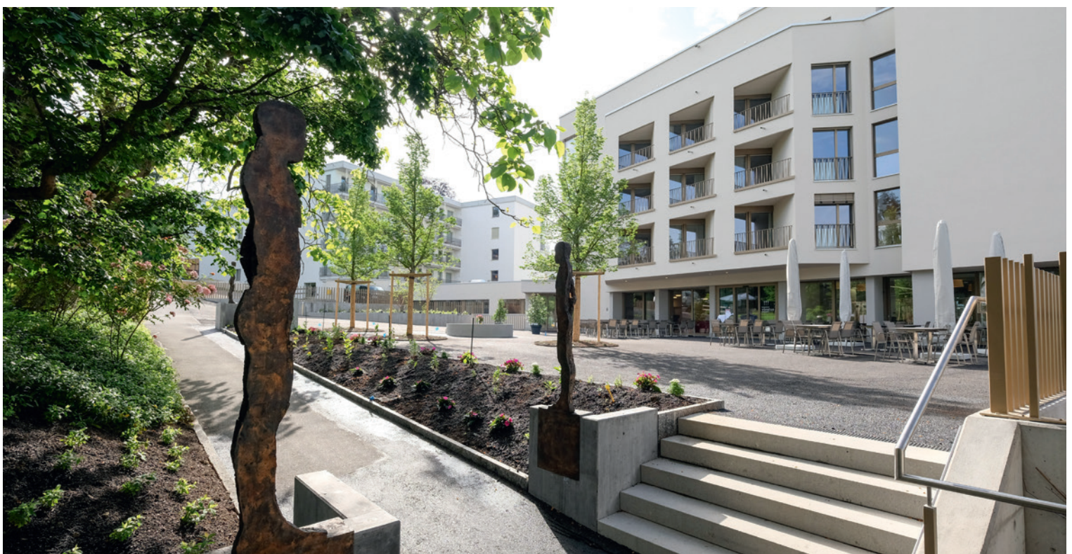
Viva Luzern Dreilinden – l'un des cinq sites de Viva Lucerne