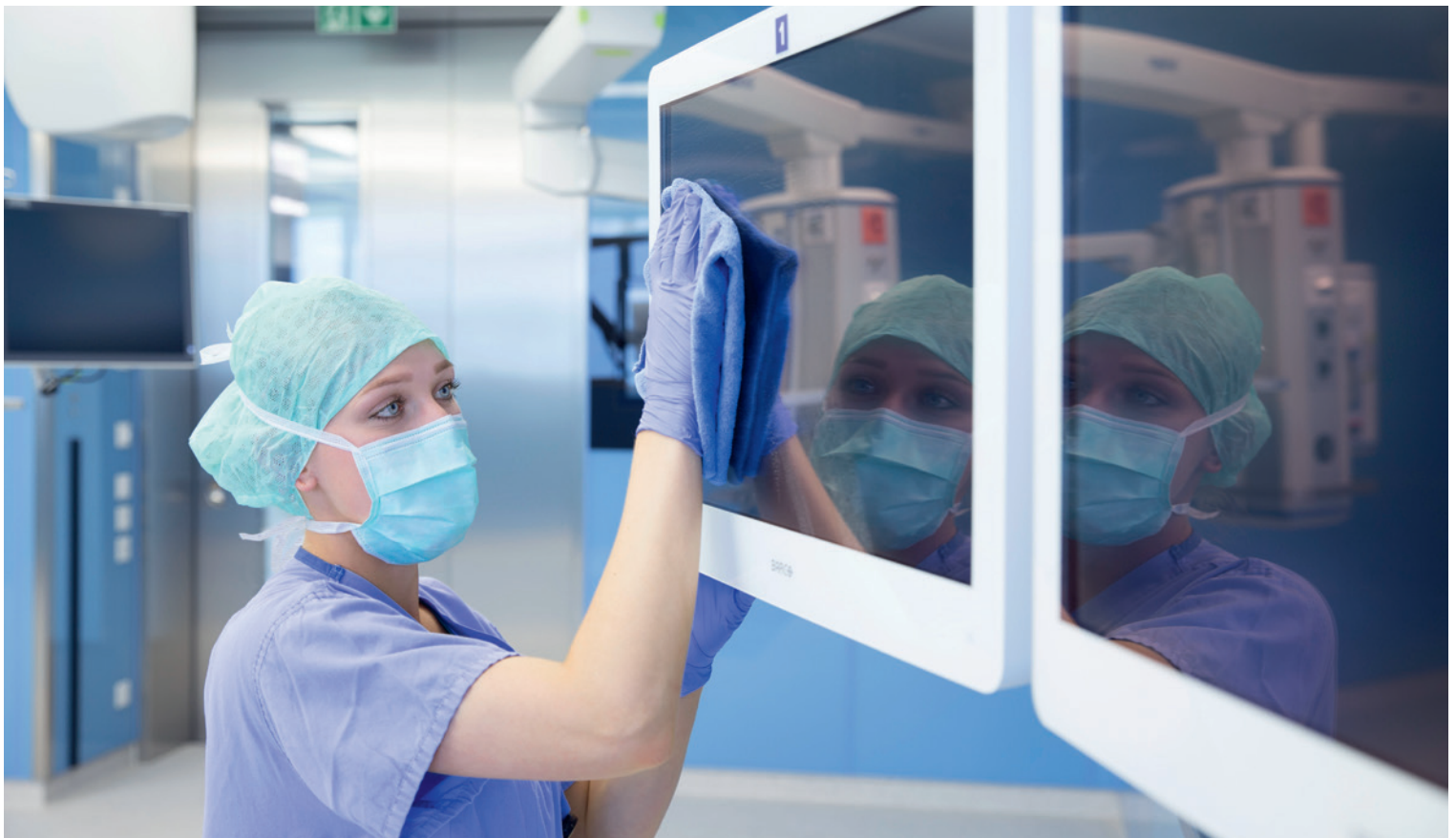
Bild 1: Richtig desinfizieren ist eine anspruchsvolle Aufgabe, die im Spital- und Heimbereich eine ganz besondere Aufmerksamkeit verdient.

Besonders kritisch sind solche Infektionskrankheiten, wenn zum Beispiel in Spitälern bereits