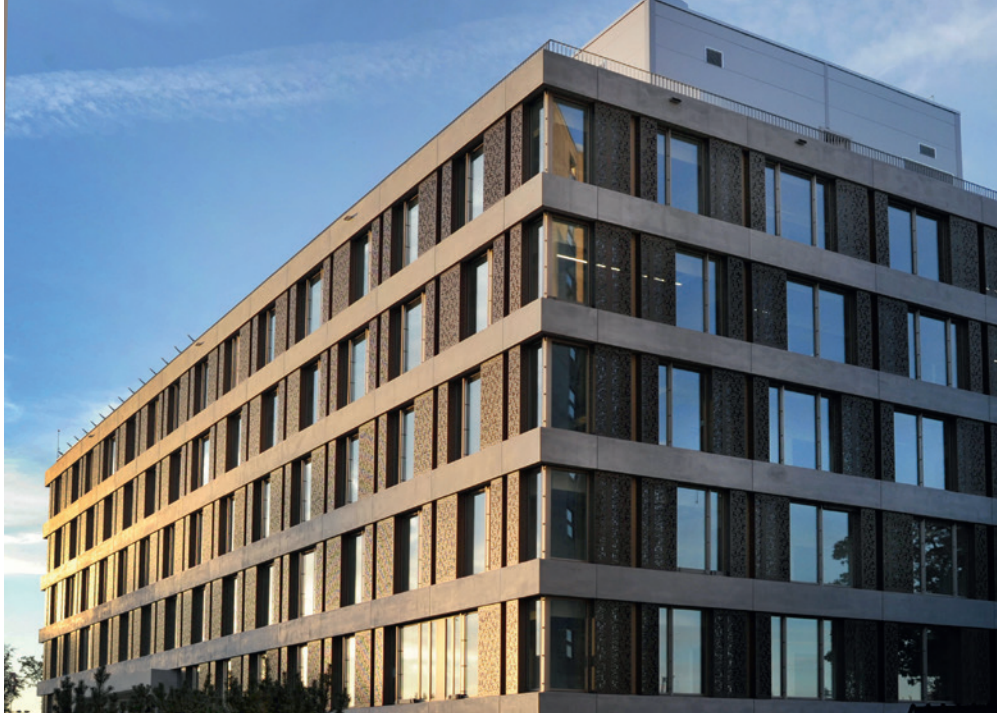
Das KSB Partnerhaus wurde im Frühjahr 2018 eröffnet. Hier ist unter anderem der Health Innovation Hub angesiedelt.

tive Dienstleistungen und Produkte zu entwickeln, die unsere Prozesse und Arbeitsweisen noch effizienter und/oder kostengünstiger machen. Unser Ziel ist es, innovative Geschäftsideen im Gesundheits- und Spitalwesen zu unterstützen.