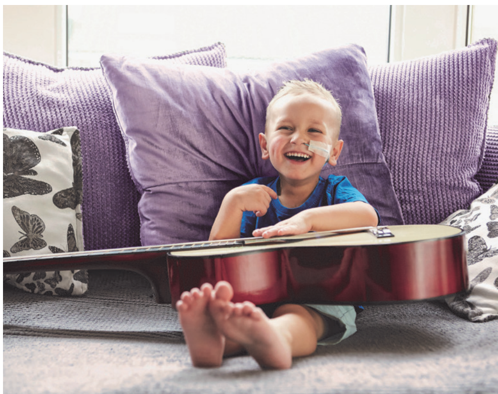
Die «Astronautenkost» gibt heute vielen Patienten ein Stück Kraft und Lebensqualität.

Im hochmodernen konzerneigenen internationalen Forschungszentrum im niederländischen Utrecht arbeiten mehr als 400 Mitarbeiter an der Entwicklung von innovativen Produkten für die enterale Ernährungstherapie. Die Forschungs- und Entwicklungsarbeit konzentriert sich dabei vor allem auf die Therapiefelder Onkologie, Frailty/Gebrechlichkeit, Schlaganfall, Intensivmedizin und Alzheimer-Erkrankung im Frühstadium, bei der Kinderheilkunde liegt der Fokus auf dem Bereich Kuhmilchallergie, Gedeihstörung, seltene erbliche Stoffwechselstörungen und kindliche Epilepsie. Auch die Entwicklung besonders anwenderfreundlicher und sicherer Verpackungen wird stetig vorangetrieben: Zuletzt konnte mit dem SmartPack ein neues Behältnis für Sondennahrungen eingeführt werden, das Dank des praktischen Designs eine vereinfachte und unkomplizierte Handhabung und eine besonders sichere und hygienische Versorgung der Patienten fördert.