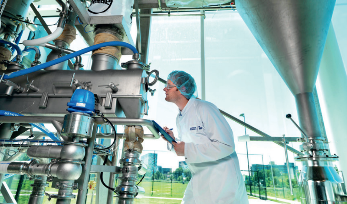
Im konzerneigenen Forschungszentrum entwickeln Wissenschaftler neue Ansätze für die Ernährungsforschung.

Nüchternheit vor der Operation und förderte gleichzeitig den gewünschten relativ keimarmen Zustand des Darmes.