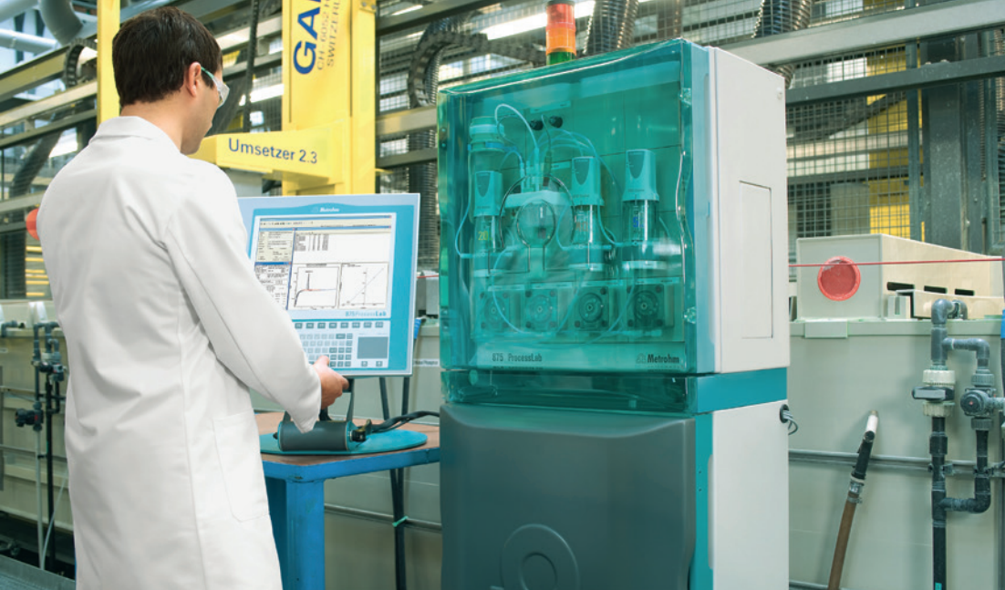
Vollautomatischer Prozessanalysator an Ort und Stelle: In der Prozessumgebung erhält der Mitarbeiter eine umfassende Unterstützung.

schöne neue Welt transferiert zu werden. Denn wenn «Robby» mit einem Arm ein Vial greifen kann, dann kann er zum Beispiel auch mit zwei Armen komplexe Pipettieraufgaben lösen.