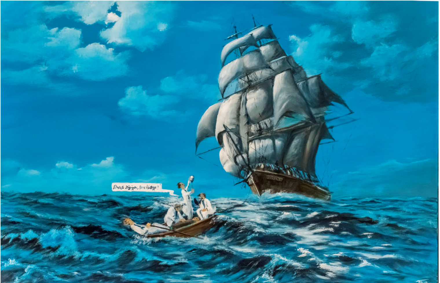
Ein klarer Kurs ist auch bei Hygienemassnahmen Gold wert. Manchmal geht es auch dort darum, Schiffbrüchige wieder an Bord zu nehmen.

nahmen und Begleitung der Durchführung, Kontrolle der Wirksamkeit der Desinfektion