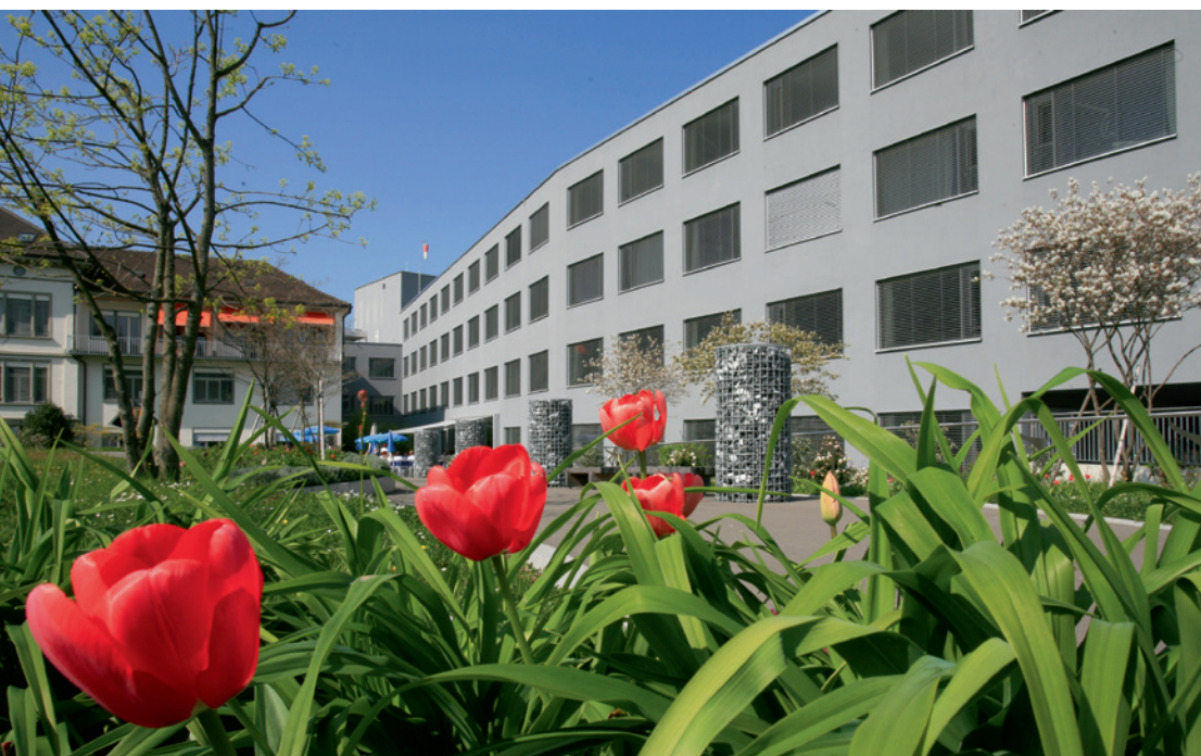
Die beiden ehemaligen Spitäler Zimmerberg in Horgen (oben) und Sanitas in Kilchberg fusionierten am 1. Januar 2011 zum See-Spital. Der Zusammenschluss der beiden Häuser ist eine Reaktion auf den zunehmenden Kostendruck und eine strategische Neupositionierung vor dem Hintergrund der neuen Spitalfinanzierung.

Strukturen bezüglich Aufbau- und Ablauforganisation voraussetzt. Da aber die definitive Organisationsstruktur ebenfalls noch entwickelt werden musste, entschied sich Logicare für eine rollende Planung. In einer ersten Priorisierung definierte das Engineering von Logicare die Zusammenlegung der Systeme Abrechnung, Finanzbuchhaltung, Personal, Logistik und Betriebsbuchhaltung sowie des E-Mail-Systems.