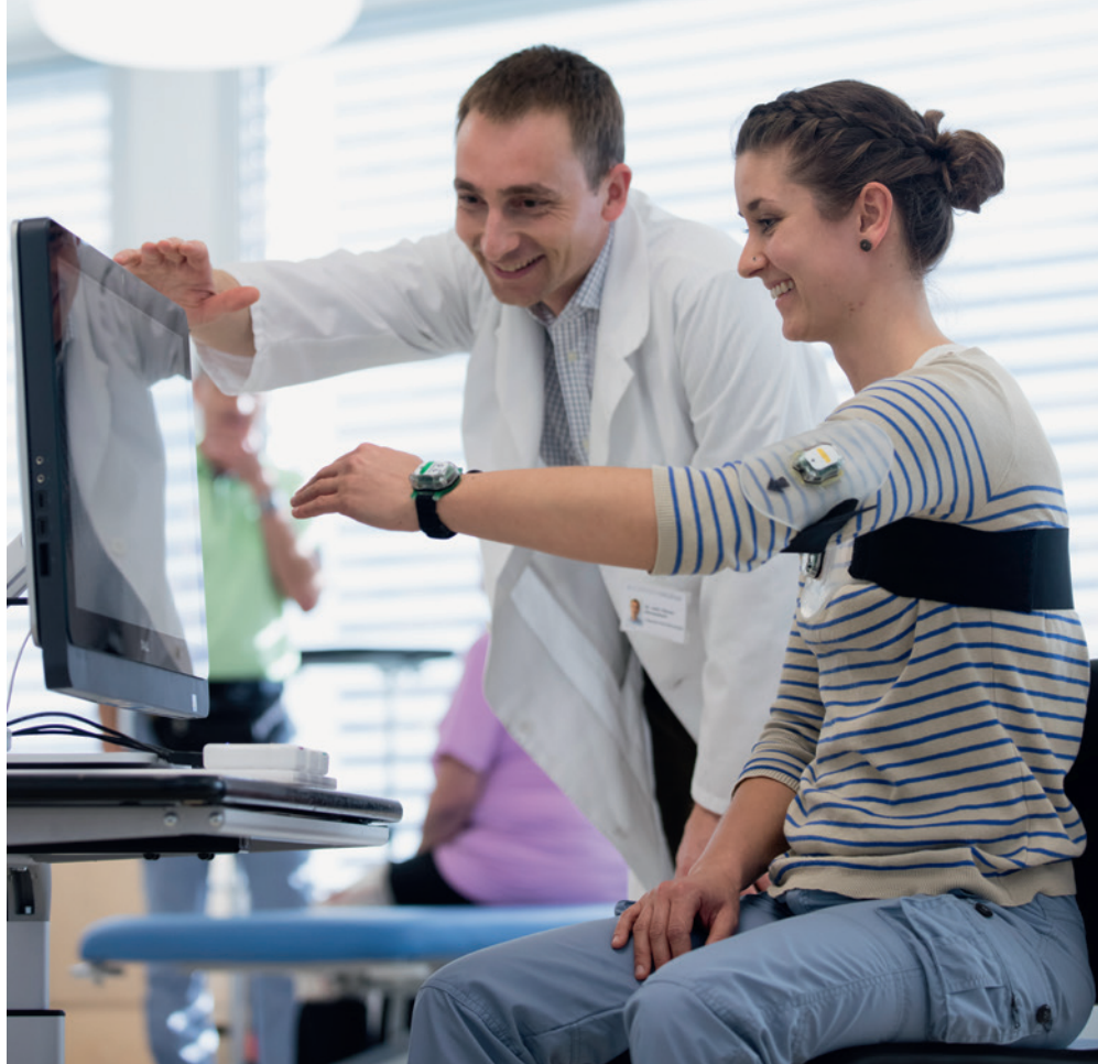
Motivation ist äusserst wichtig für eine wirkungsvolle Bewegungstherapie. Dafür können beispielsweise Games am PC sorgen, um die Beweglichkeit von Armen, Händen und Fingern zu fördern.