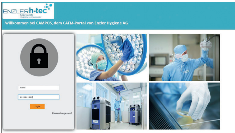
Login bei CAMPOS auf www.enzlerh-tec.com

Werkzeug für all diese Belange. So können Wartungsaufträge geplant, Störungen erfasst und weitergemeldet sowie Zuständigkeiten verwaltet werden.