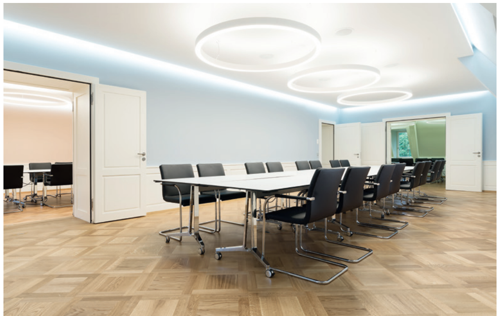
Stilvolle und helle Tagungsräume in der Gründervilla Boveri

liche Zimmer zugegriffen werden kann. Rechnet man die Möglichkeiten der Hotels im unweit gelegenen Zürich-West dazu, können auch weit grössere Events durchgeführt werden. Für Tagesveranstaltungen ist das Raumangebot in