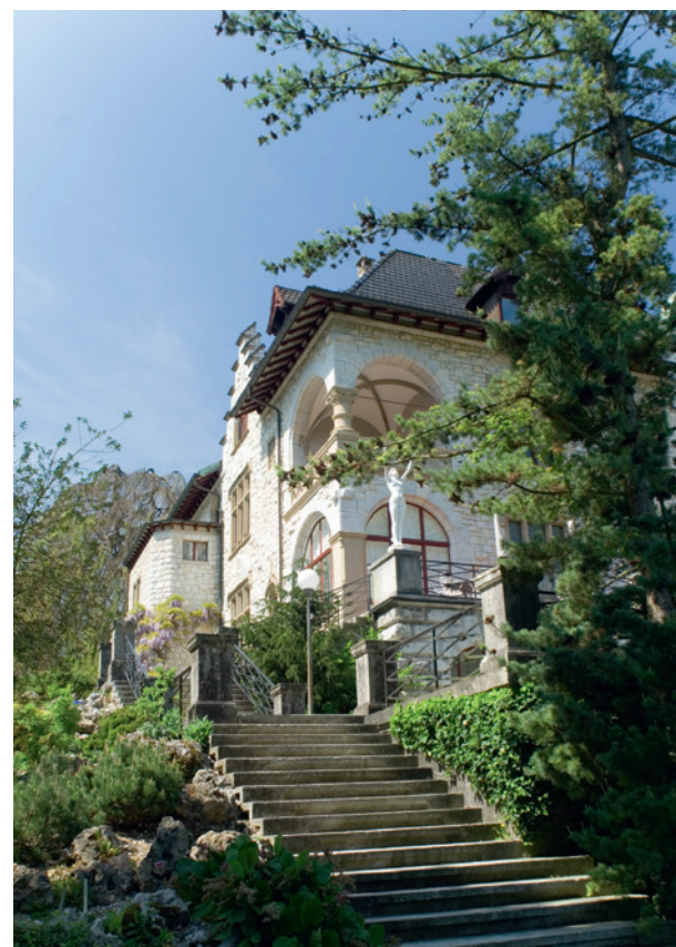
Tagen im Grünen: Villa Boveri