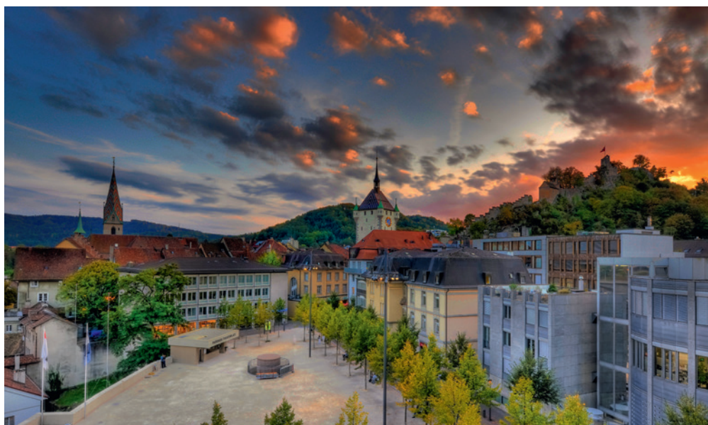
Blick auf die malerische Altstadt.