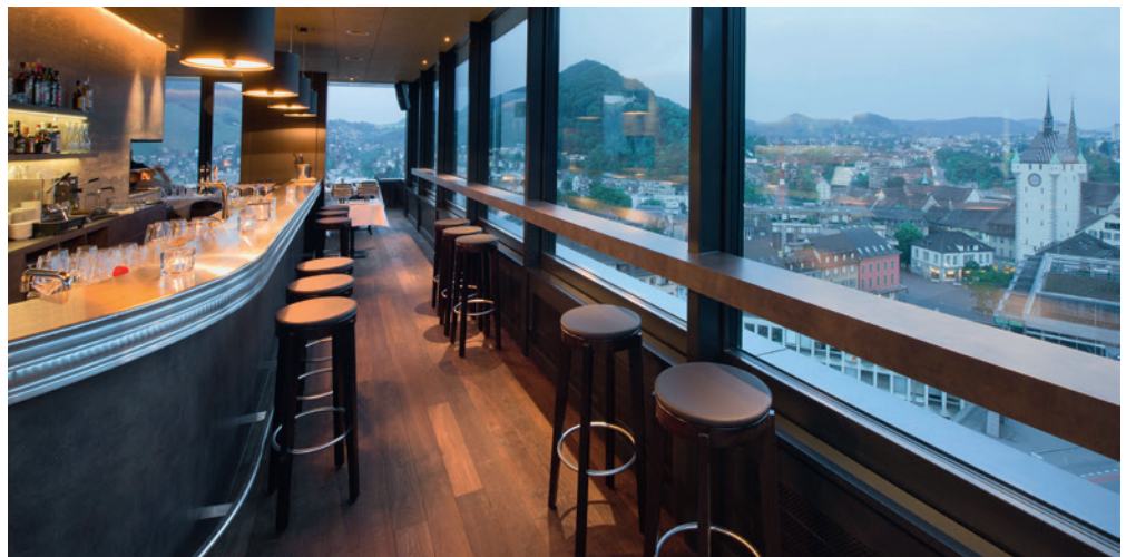
Weitblick über die Stadt: Restaurant Torre