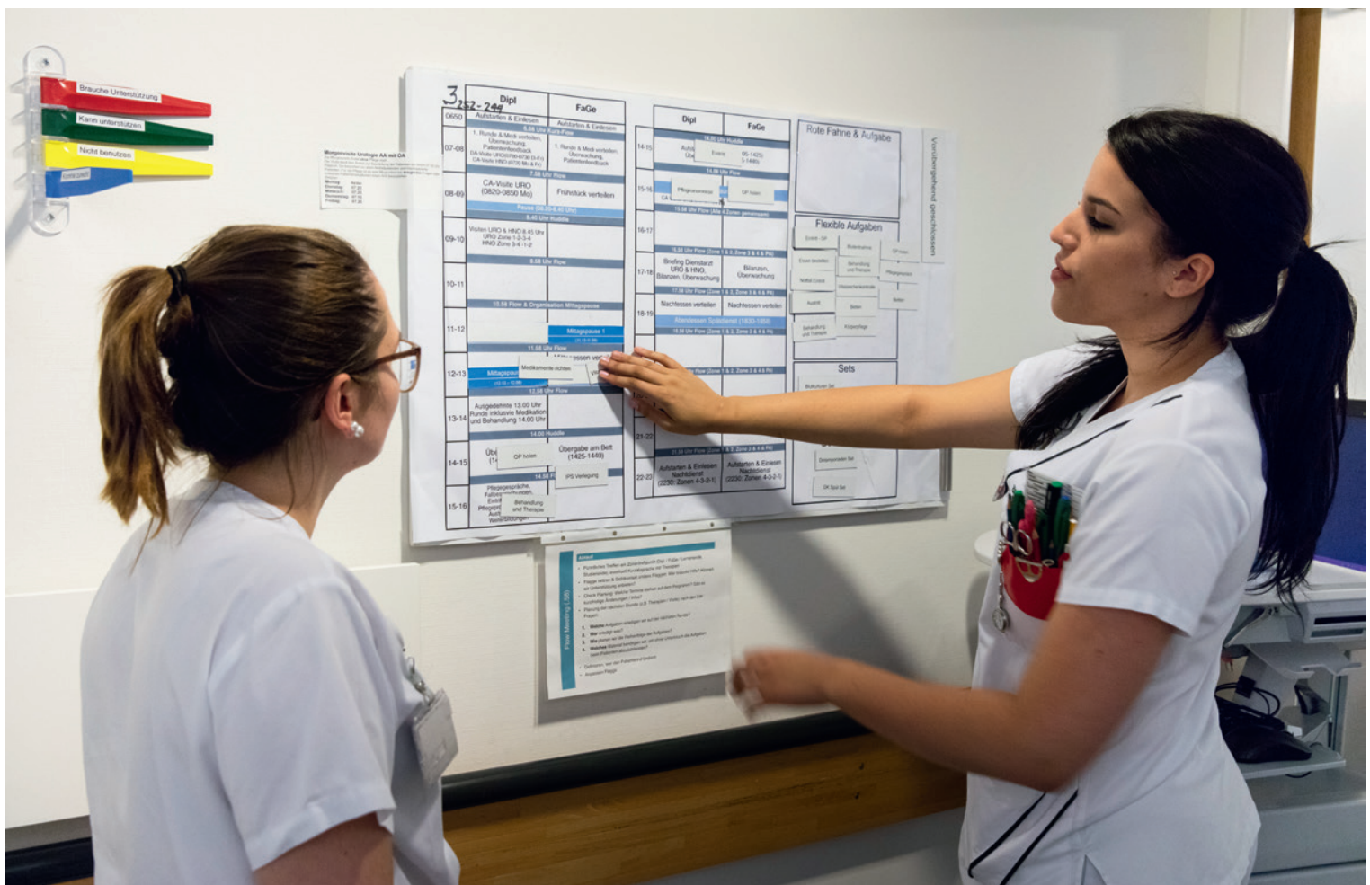
Aufgaben, die nicht zwingend zu einem bestimmten Zeitpunkt erledigt werden müssen, werden als flexible Tätigkeit eingeplant. Durch einen Tagesplan wird der Bedarf nach kurzfristiger Rücksprache und Störungen reduziert. Alle, die mit dem Patienten arbeiten, planen ihre flexiblen Aufgaben vorausschauend.