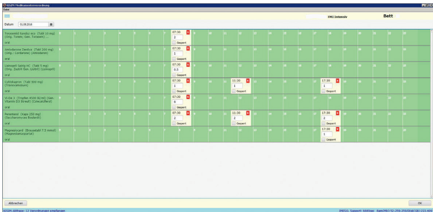
Abbildung 4: Benutzeroberfläche der PDMS-Medikationsverordnungen an KISIM

dem Leiter der Intensivpflege, Stefan Leis (Spital Interlaken), der alle Teilschritte spitalseitig betreut und somit einen grossen Anteil am Erfolg dieses Projektes hat.