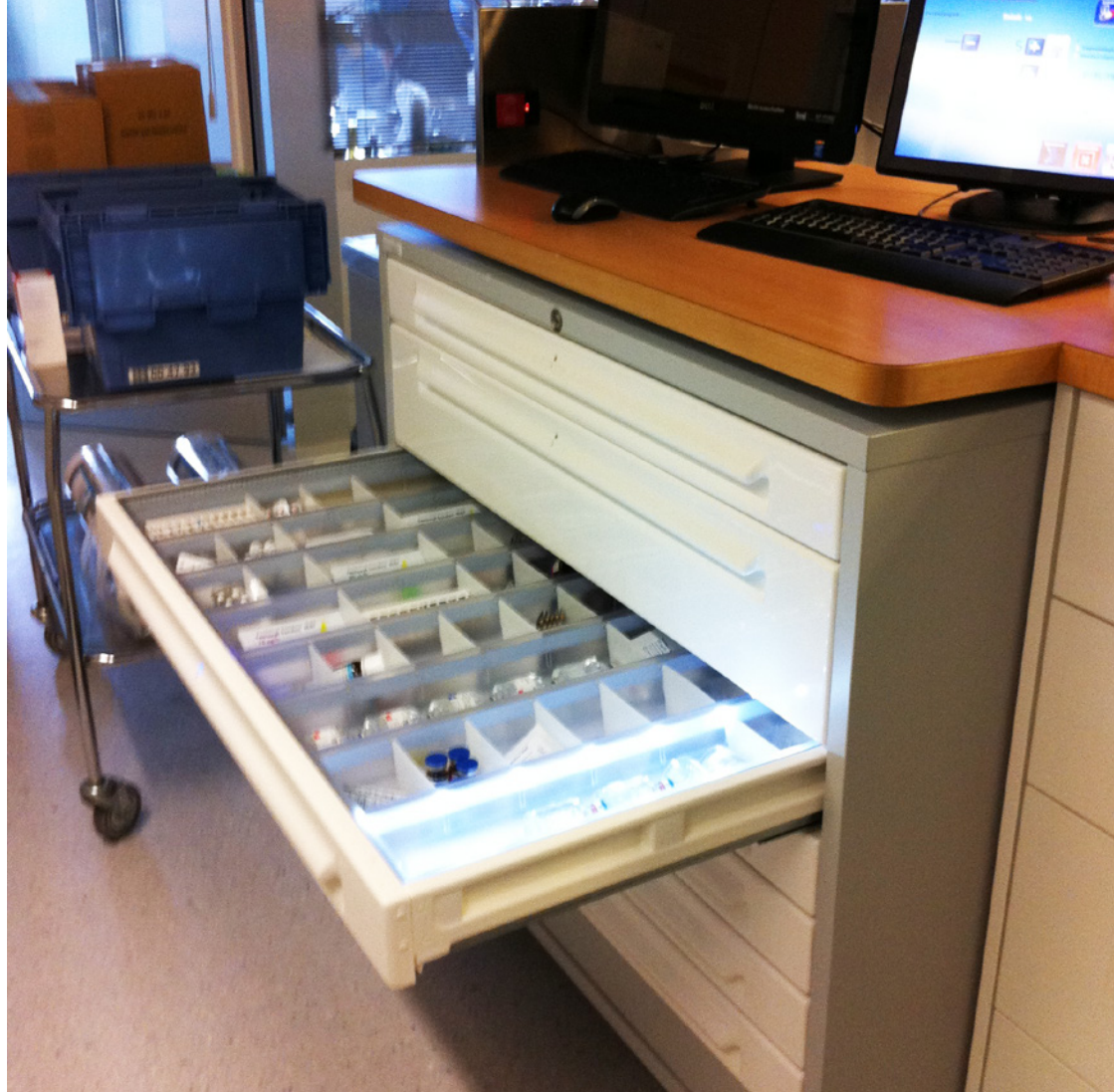
Abbildung 2: PDMS-Arbeitsplatz in Verbindung mit einem HSD-Medikationsschrank

Der Medikamentenschrank stellt aufgrund dieser Information eine Patientenliste bereit und entriegelt anhand der platzierten Verordnungen