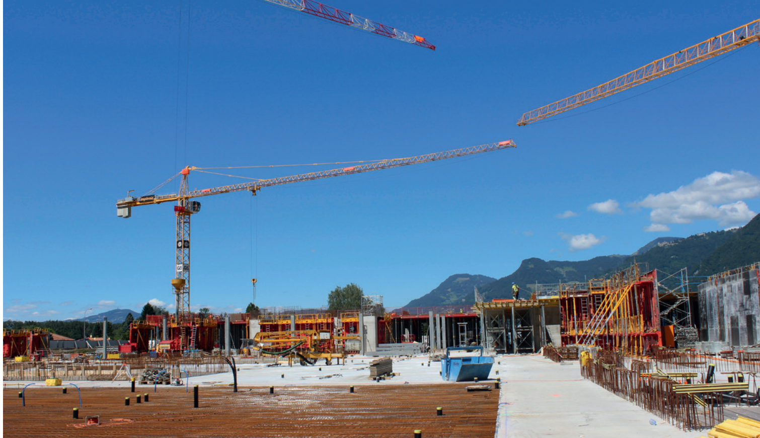
Le grand chantier en bref: les travaux de construction progressent rapidement grâce à la planification et la direction de projet parfaitement coordonnées entre l'hôpital et Steiner.

Rennaz (VD) sera très facilement accessible: en voiture via la sortie d'autoroute Villeneuve et en train, via la gare CFF de Villeneuve, à seulement 2,5 km de là. De la gare, un bus conduira les visiteurs directement jusqu'à l'entrée de l'hôpital.