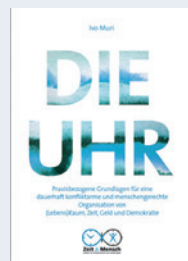
Buch „Die Uhr“ ISBN 978-3-905788-00-6