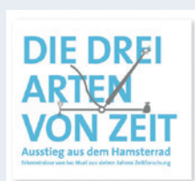
Hörbuch „Die drei Arten von Zeit“ ISBN 978-3-905788-02-0