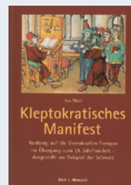
Buch „Kleptokratisches Manifest“ ISBN 978-3-905788-04-4

Lesen Sie, staunen Sie und vor allem: Denken Sie selbst!