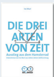
Buch „Die drei Arten von Zeit“ ISBN 978-3-905788-05-1