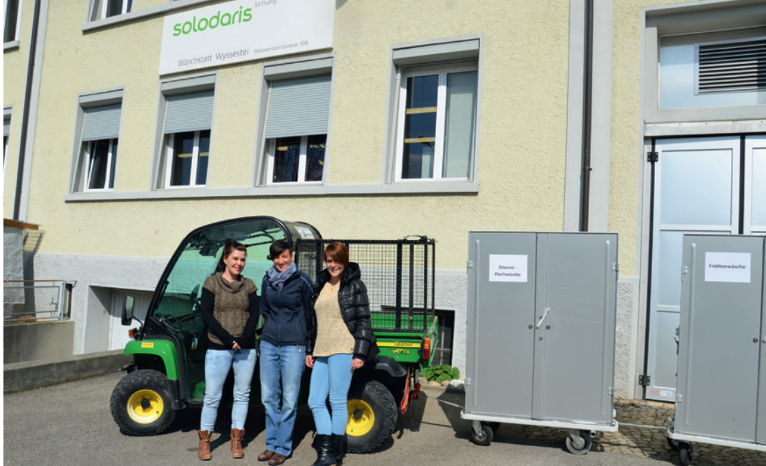
Le linge propre est prêt d'être rendu fraîchement parfumé aux clients.