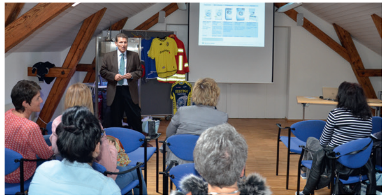
Impressions de l'événement Wet-Clean