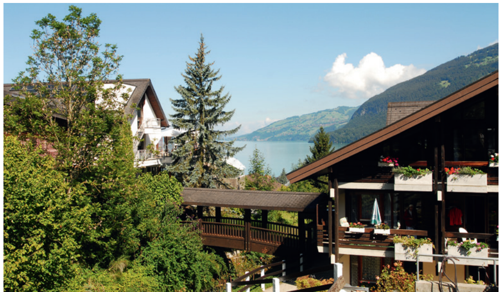
L'établissement médico-social Oertlimatt, dans le canton de Berne, s'est doté en 2014 d'un chauffage central qui fonctionne à l'aide de copeaux de bois, grâce au soutien de la Fondation Suisse pour le Climat.

L'entreprise a commencé, il y a quelques années, à adopter des techniques plus modernes destinées à réduire sa consommation d'énergie en remplaçant progressivement toutes les sources lumineuses par des éclairages LED, et en restructurant ses dispositifs d'éclairage. Ce processus connaîtra sous peu son point d'orgue avec la transformation du système de chauffage. Cet ouvrage comprend la réalisation d'une pompe à chaleur de 350 kW, équipée de vingt-cinq sondes géothermiques destinées à fournir le meilleur rendement possible. Dans son cheminement, l'entreprise Parco Maraini a pu compter sur le soutien actif de la Fondation Suisse pour le