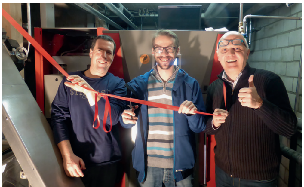
Inauguration du nouveau chauffage central par l'équipe de l'EMS Oertlimatt.