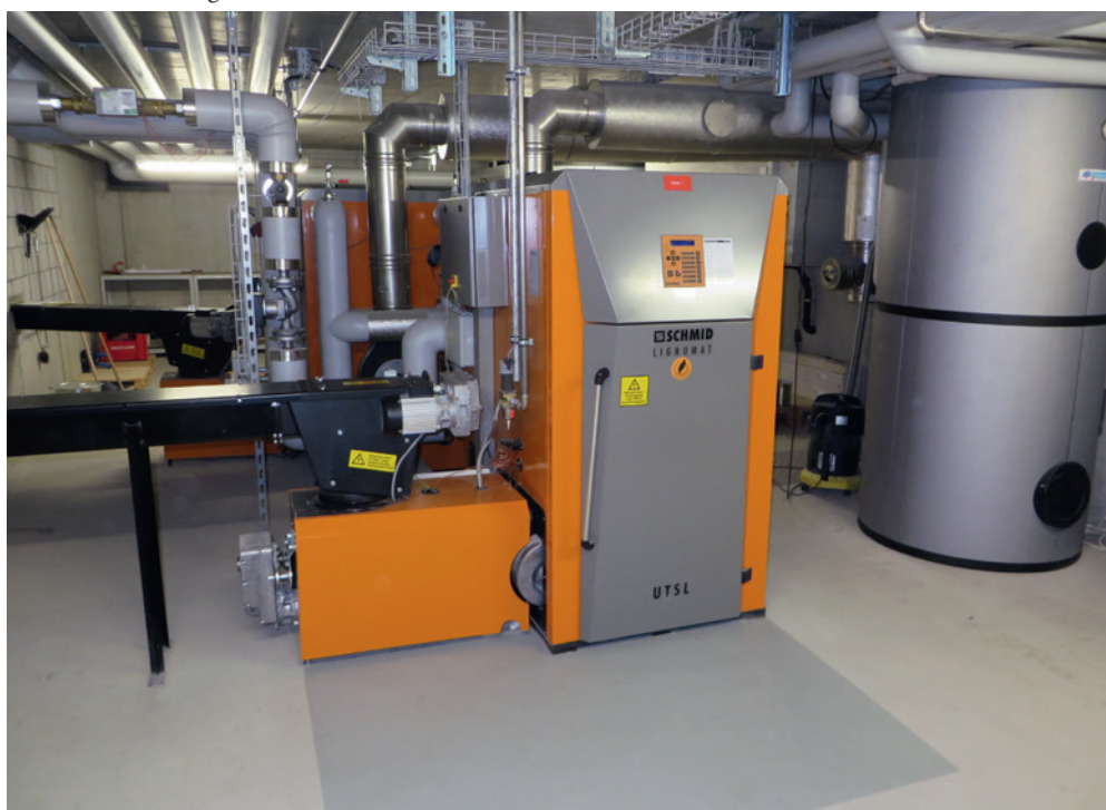
Le nouveau chauffage central de l'EMS Oertlimatt.

par une utilisation efficace et ciblée des recettes provenant de la taxe CO 2 .