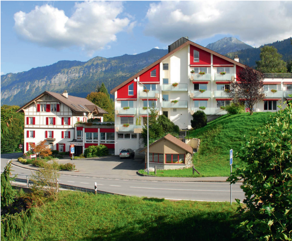
Grâce à cet investissement, l'EMS Oertlimatt économise chaque année environ 50 000 litres de carburant fossile.

Climat, qui a procédé à une analyse approfondie du projet avant de lui accorder un financement substantiel, qui sera versé à mesure que les travaux progressent.