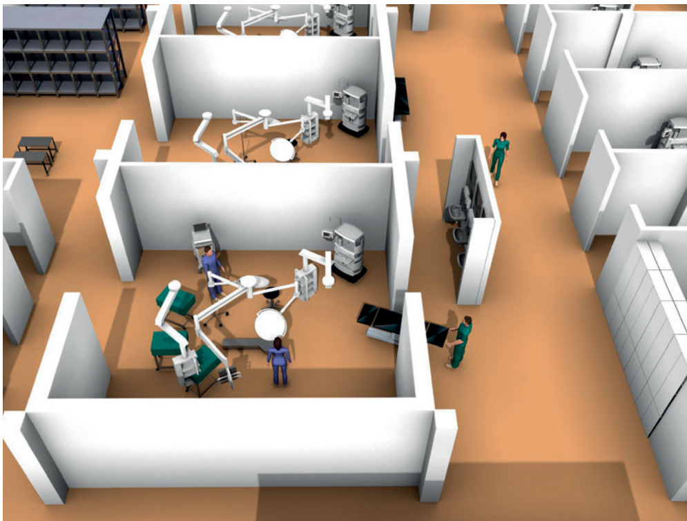
Abbildung 3: Virtuelle Inbetriebnahme eines OP-Bereichs

Neben Prozessalternativen lassen sich auch benötigte Raum-, Material- und Personalressourcen mit Hilfe einer OP-Simulation untersuchen und optimal zuteilen. Zentrale Fragestellungen sind neben der Anzahl benötigter Operationsäle für ein spezifisches Spektrum an Patienten