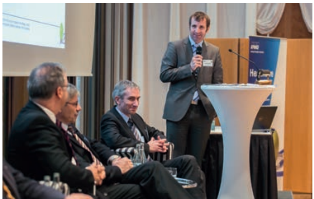
Spannende Vorträge und Podiumsdiskussionen am vergangenen Healthcare Event 2012 der KPMG