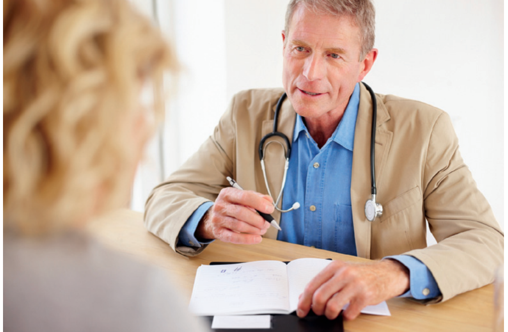
Beim Hausarzt beginnt's: Er unterstützt seine Patienten beim individuell abgestimmten Einsatz der speziellen Versicherungskarte.

«Als zweiten positiven Punkt sehen wir die Verbesserung der Transparenz und die Kontrolle bei den Leistungserbringern. Wer sich bei e-toile beteiligt, führt seine Eintragungen ins Patientendossier besonders sorgfältig aus, denn er weiss, dass seine Informationen exakt sein müssen und für einen weiteren Behandelnden wertvolle Angaben bedeuten können. Aufgrund dessen hat sich der Vernetzungsgedanke bei uns im Kanton erst so richtig entwickelt. Dass bei