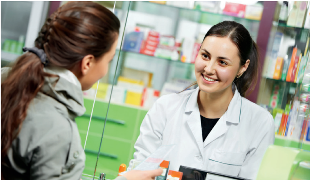
Die Apothekerin: eine wichtige Partnerin im Projekt e-toile des Kantons Genf.

wichtigsten Gesundheitsakteure, stellen das Selbstbestimmungsrecht und die Eigenverantwortlichkeit von Patienten in Bezug auf ihre medizinischen Daten die wichtigste Neuerung des Genfer Projekts dar.