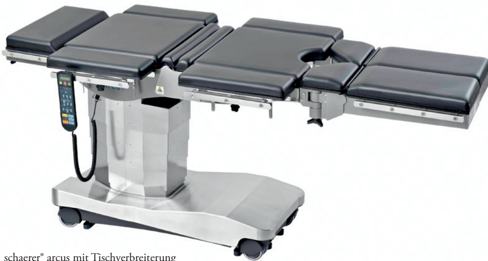
schaerer® arcus mit Tischverbreiterung

100 Jahre ist es her, seit Schaerer Medical, noch unter dem Namen M. Schaerer AG, den ersten «mobilen» Operationstisch der Welt präsentierte. Das Modell X wurde damals zusammen mit Professor F. de Quervain entwickelt und gewann nach einer Überarbeitung schliesslich 1914 den «Grand Prix» einer internationalen Ausstellung in Paris. Heute ist die Schaerer Medical AG weltweit erfolgreich.