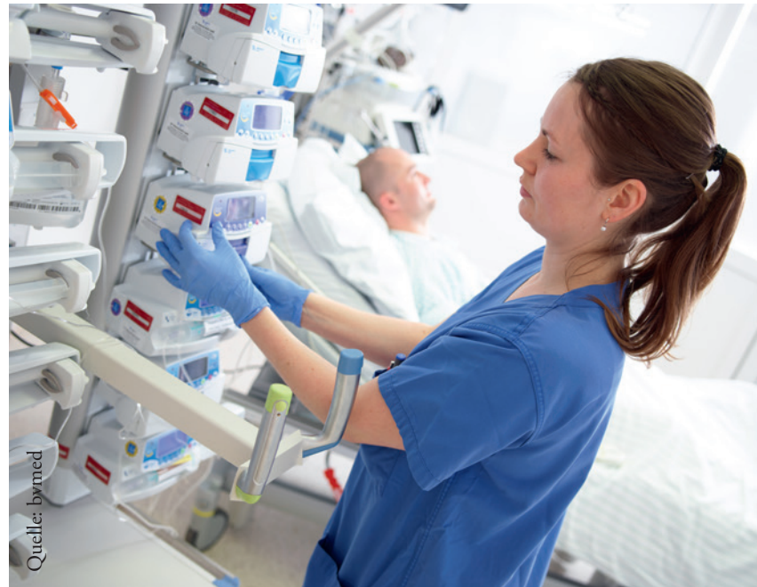
Intensivstation mit modernster Medizintechnik