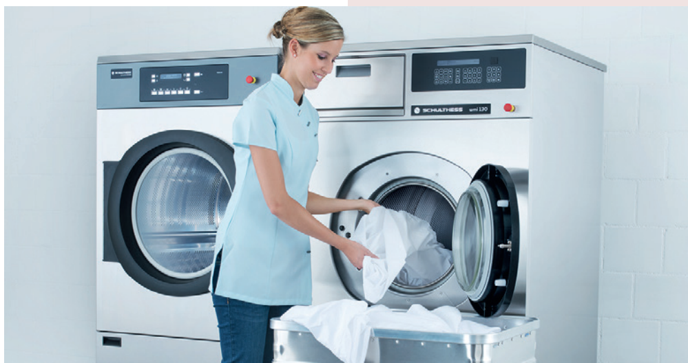
La nuova generazione di lavatrici Spirit Industrial WMI consente di migliorare il lavaggio professionale con una tecnologia intelligente e moderna e valori ecologici ottimizzati.

Die neue Waschmaschinen-Generation Spirit Industrial WMI verbessert das professionelle Waschen durch intelligente, moderne Technik und optimierte umweltfreundliche Werte.