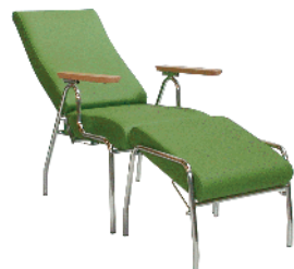
BlaserLento Ruhe und Entspannung

W. Blaser AG · Einschlagweg 29 · 3400 Burgdorf Telefon 034 422 12 72 · Fax 034 423 21 87 · info@blasersystems.ch · www.blasersystems.ch