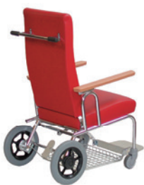
BlaserMobil Transport und Transfer