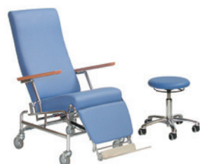
BlaserSana Behandlung und Therapie