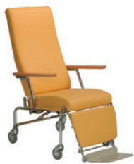
BlaserCare Pflege und Rehabilitation